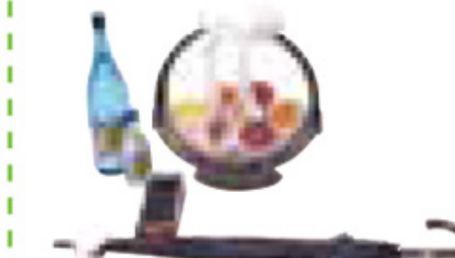
出棺セット (花束なし)