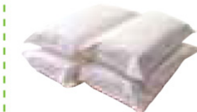
ご遺体保全処置 (一日分)