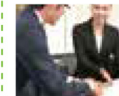
アフターサポート