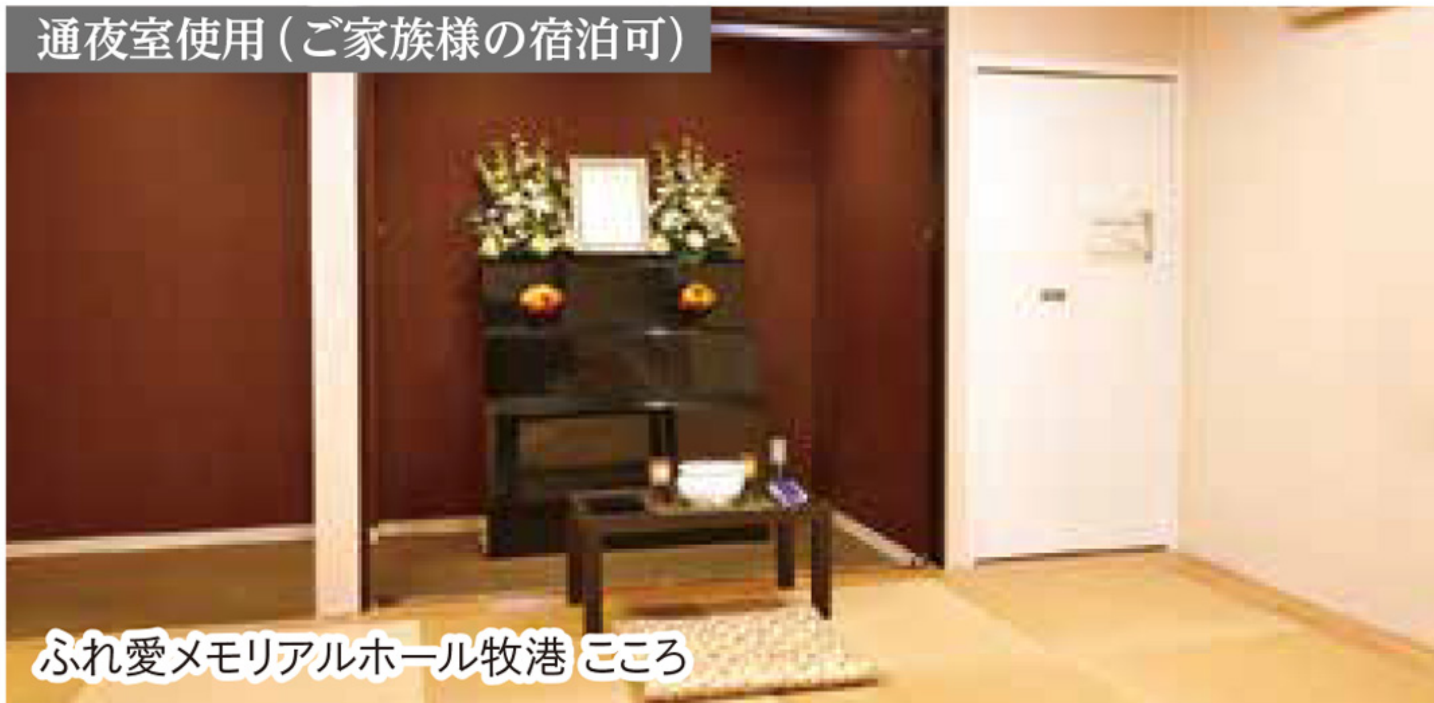
ふれ愛メモリアルホール 牧港 ころろ