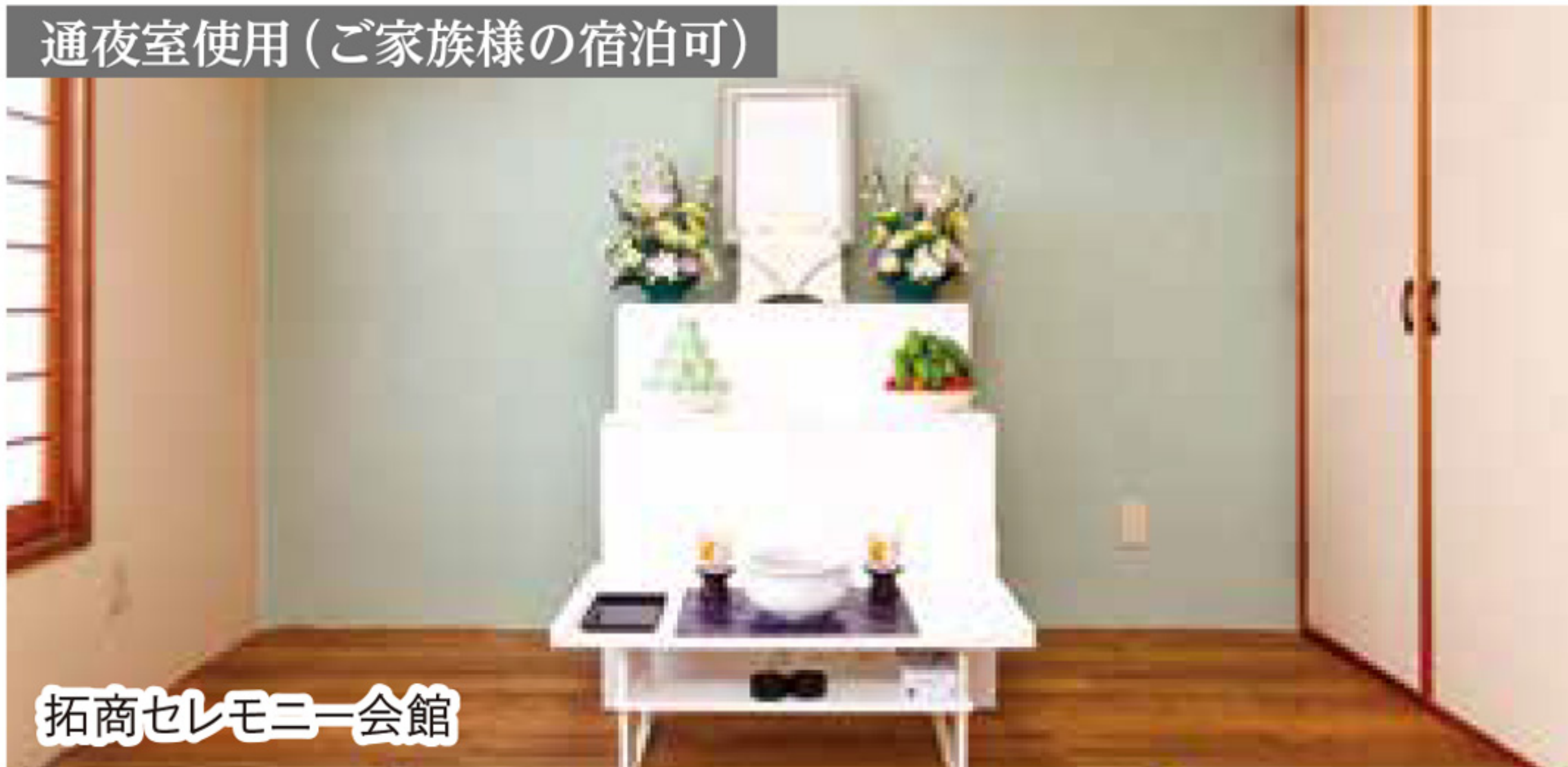
拓商セレモニー会館