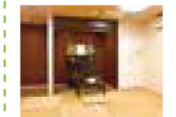
通夜室使用料 (一日分)